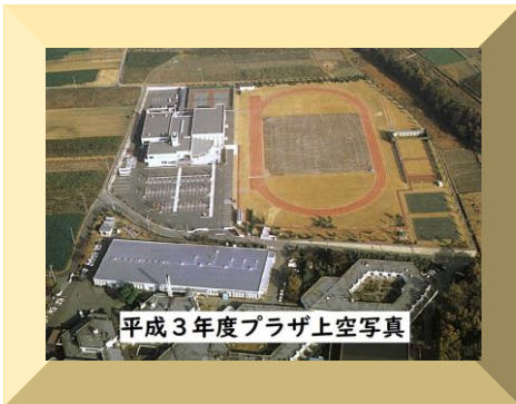
平成3年度プラザ上空写真