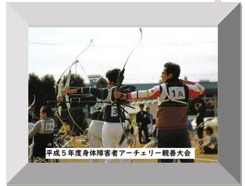
平成5年度身体障害者アーチェリー親善大会