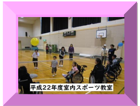
平成22年度室内スポーツ教室