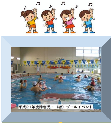
平成21年度障害児・(者) プールイベント