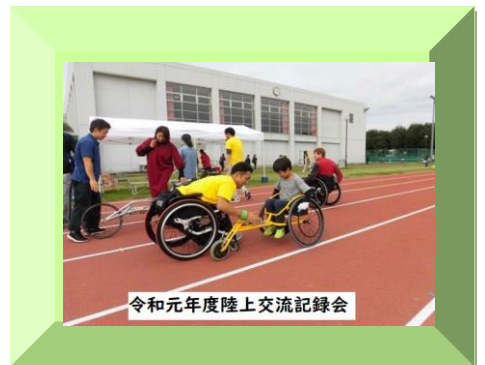
令和元年度陸上交流記録会

30年間様々な事業を行ってきました。 これからも皆さまに楽しんでいただけるよう努めてまいります。