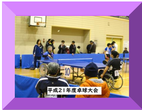
平成21年度卓球大会