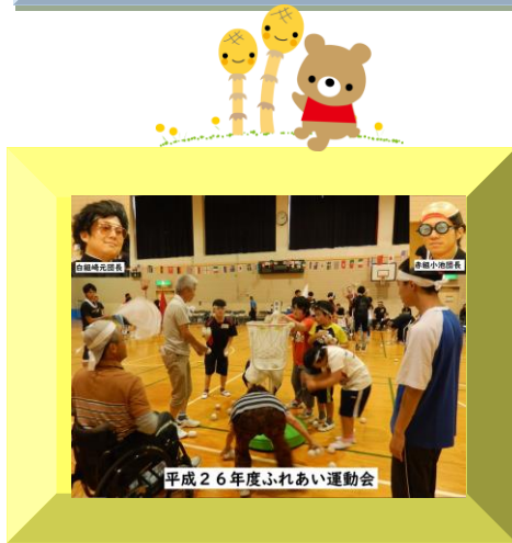
平成26年度ふれあい運動会