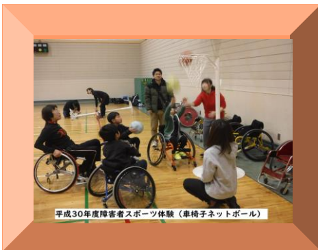
平成30年度障害者スポーツ体験(車椅子ネットボール)